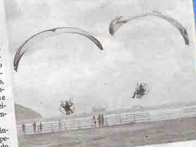
Competidores deram show no último dia de prova, no Gonzaga

O Fly Games World, campeonato mundial de paramotor, agitou o Praia do Gonzaga, em Santos, na manhã de ontem, quando ocorreram as finais. A competição reuniu 16 atletas de diversos países, foi realizada pela primeira vez no Brasil e teve como primeiro vencedor o francês Laurent Salas. O grande vencedor foi Laurent Salas, que conseguiu o tempo de 2 minutos, 26 segundos e 78 centésimos, superando o francês Jean-François Mateo, que marcou o tempo de 2 minutos, 28 segundos e 47 centésimos na final. A terceira colocação ficou com o também francês Pascal Vallée.